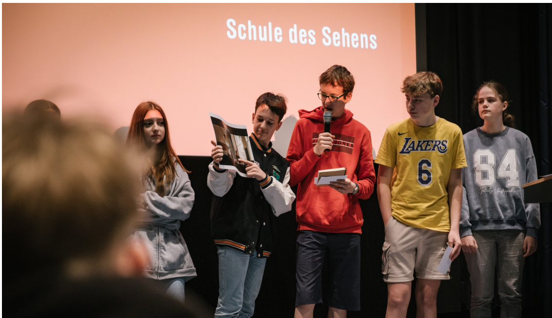
Schule des Sehens

DOK.education, das Filmbildungsprogramm des DOK.fest München, vermittelt Schüler*innen seit über zehn Jahren, wie Dokumentarfilme gelesen werden können. In den erfolgreichen Schulklassen-Workshops der Schule des Sehens verbinden sich Medienkompetenz, Empathiebildung und kulturelle Bildung zu einer ganzheitlichen Lernerfahrung. Zwei bedeutende Erweiterungen des diesjährigen Programms sind das Gern gesehen! Ticket, das Schüler*innen mit besonderen finanziellen Herausforderungen einen kostenfreien Kino-Besuch ermöglicht, sowie das Angebot Schule des Hörens . Dieses fokussiert die Wahrnehmung von Filmmusik, beleuchtet die Arbeit von Komponist*innen und Sounddesigner*innen und thematisiert die Bedeutung von Klang und Musik im dokumentarischen Erzählen.