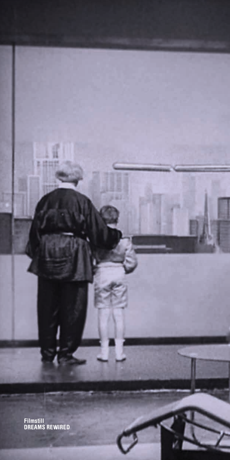
Filmstill DREAMS REWIRED