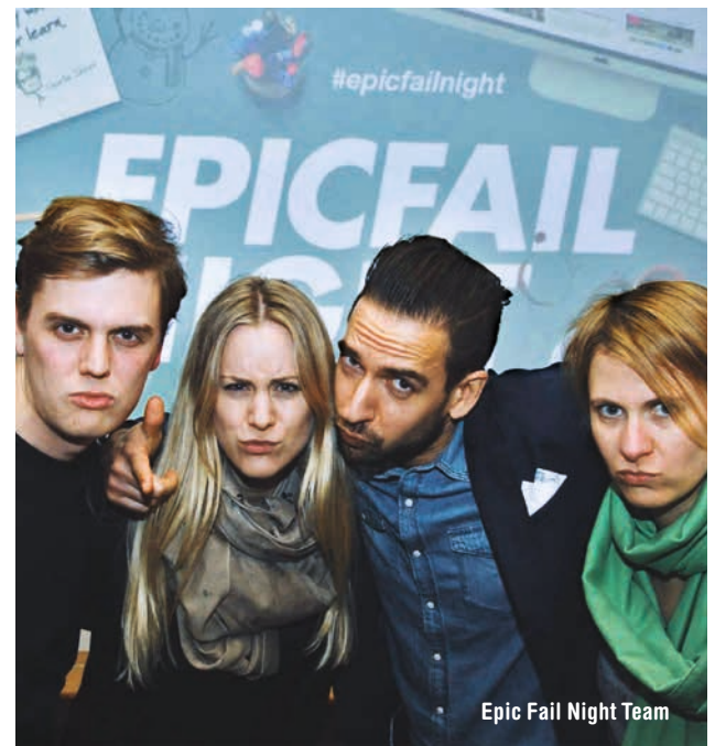
Epic Fail Night Team

In Kooperation mit Epic Fail Night www.facebook.com/TheFUNMunich/