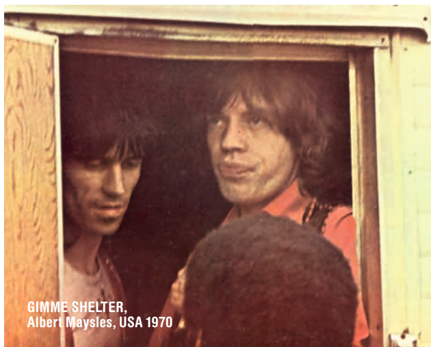
GIMME SHELTER, Albert Maysles, USA 1970

Ab 18.30 Uhr ist im HFF Audimax Albert Maysles Dokumentarfilmklassiker GIMME SHELTER (regulärer Eintrittspreis) zu sehen.