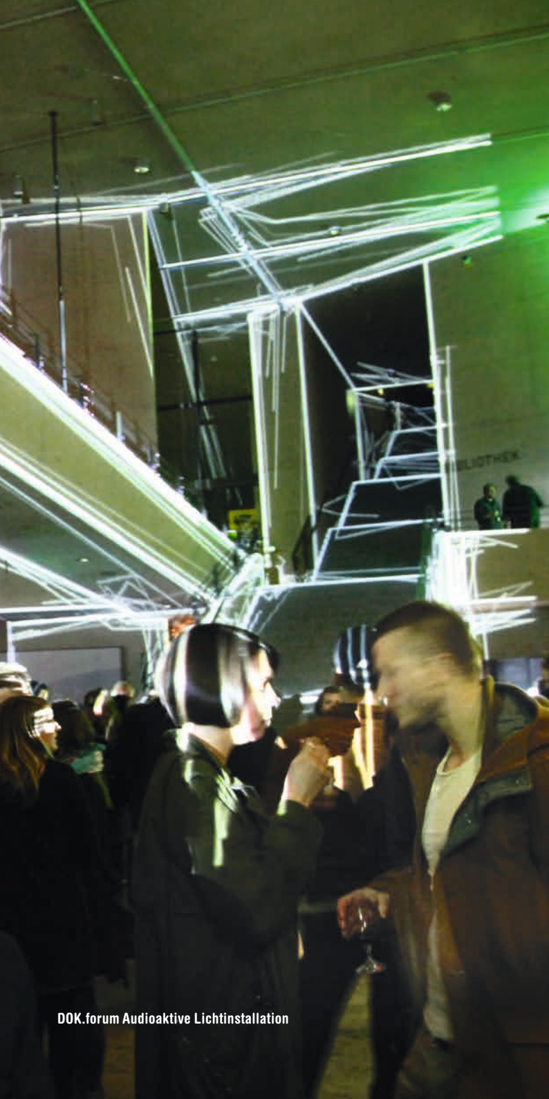
DOK.forum Audioaktive Lichtinstallation