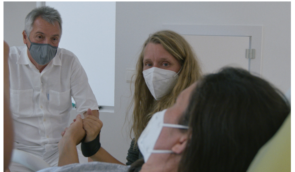
Bilder aus dem Film DER WUNSCH