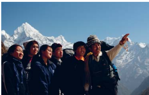
Good Bye Tibet Münchner Premieren Mi 11.05. (18:30, ARRI Kino)