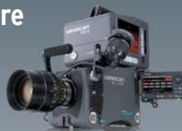
WEISSCAM HS-2 MKII