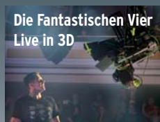
► Auf 3D Blu-ray!