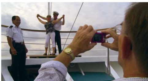
Für die Dauer einer Reise Münchner Premieren Mi 11.05. (21:00, ARRI Kino)

filmschool.forum 9:00 - 13:00 h (City 3) Eintritt frei