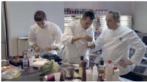
El Bulli – Cooking in Progress DOK.international Do 05.05. (19:30, ARRI Kino) W: So 08.05. (12:00, Atelier 1)