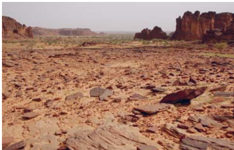
Adrift: People of a Lesser God DOK.panorama Fr 06.05. (17:00, ARRI Kino) W: Mo 09.05. (19:00, Gasteig)