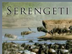
► Im Kino!