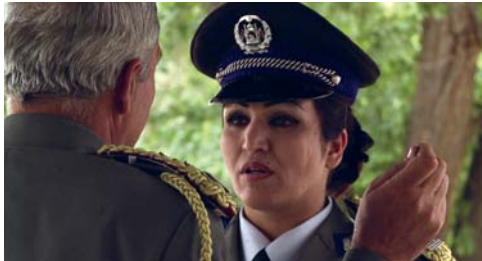
Traumfabrik Kabul DOK.panorama Fr 06.05. (20:00, Atelier 1) W: So 08.05. (17:30, Gasteig), Di 10.05. (15:00, City 3)