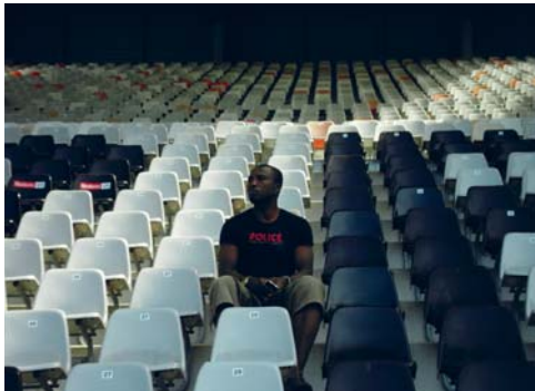
Das Schiff des Torjägers DOK.panorama Mo 09.05. (17:00, ARRI Kino) W: Di 10.05. (21:30, Filmmuseum)