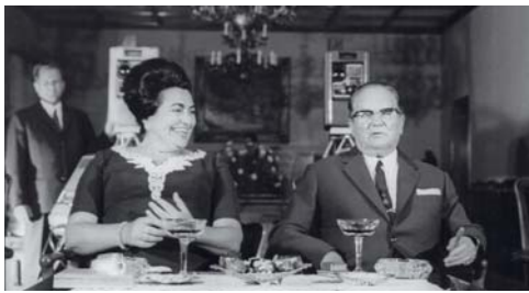
Cinema Komunisto DOK.guest Mo 09.05. (16:00, Atelier 1) W: Mi 11.05. (19:00, Filmmuseum)