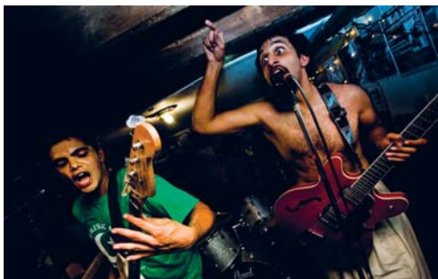
Taqwacore: The Birth of Punk Islam DOK.panorama Fr 06.05. (22:30, Atelier 1) W: Di 10.05. (22:00, Atelier 2)