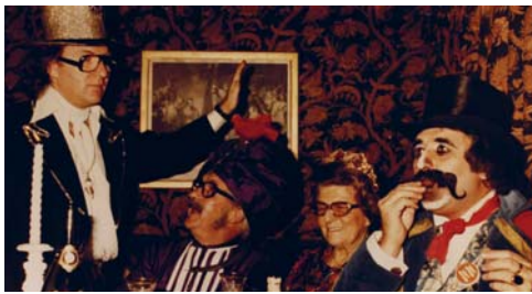
Familiensache filmschool.forum ZHdK I Di 10.05. (14:00, Filmmuseum)