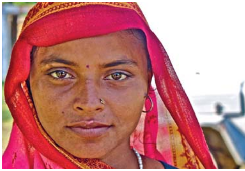
Pink Saris DOK.international Sa 07.05. (15:00, Atelier 1) W: Di 10.05. (20:00, Atelier 1)