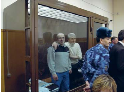
Khodorkovsky DOK.international Do 05.05. (20:00, Atelier 1) W: Sa 07.05. (17:30, ARRI Kino), Di 10.05. (15:30, Atelier 1)