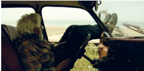
Les tortues ne meurent pas de vieillesse DOK.horizonte Fr 06.05. (17:00, Gasteig) W: Mo 09.05. (19:00, Atelier 2)