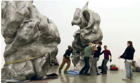
Urs Fischer DOK.panorama Sa 07.05. (15:30, Pinakothek der Moderne) W: So 08.05. (21:30, City 3)