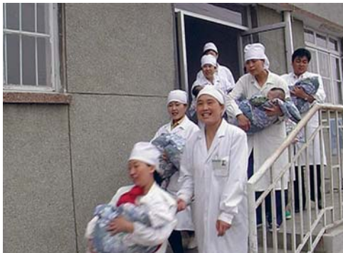
Wild Grass (Ye Cao) DOK.horizonte Do 05.05. (14:30, Atelier 2) W: Sa 07.05. (17:30, Atelier 2)

filmschool.forum 11:00 - 13:00h (Filmmuseum) Eintritt frei