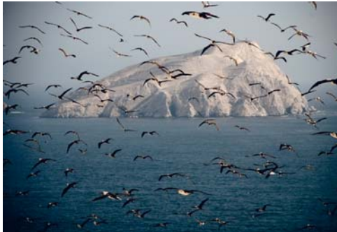
Guañape Sur Filmschool.forum ZeLIG II Mo 09.05. (16:45, Filmmuseum)