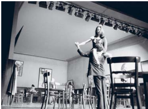
Was tun Pina Bausch und ihre Tänzer in Wuppertal? DOK.retro Sa 07.05. (18:00, Filmmuseum)

future.forum 10:00 - 13:00 h (Filmmuseum)