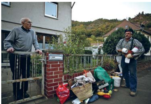
Die wundersame Reise der unnützen Dinge DOK.panorama Mo 09.05. (16:00, City 3) W: Di 10.05. (19:00, City 3)