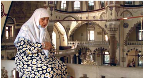
Hüllen filmschool.forum ZHdK I Di 10.05. (14:00, Filmmuseum)