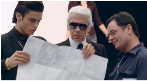
How to Make a Book with Steidl DOK.deutsch Fr 06.05. (15:30, Pinakothek der Moderne) W: So 08.05. (21:00, Atelier 2)